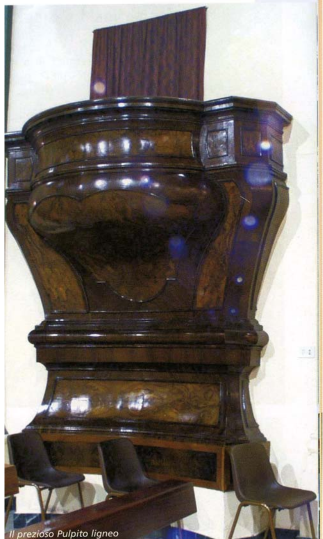
Il prezioso Pulpito ligneo