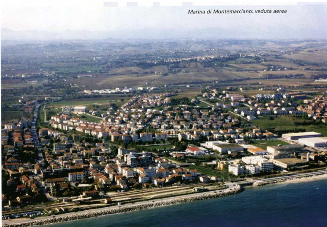
Marina di Montemarçiano: veduta aerea

Nel Comune di Montemarçiano è stata realizzata una vasta rete di percorsi agrituristici che attraversano il territorio in un costante e suggestivo contatto con la natura, per poi integrarsi con identici percorsi realizzati negli altri comuni vicini. Montemarçiano è anche un Comune a vocazione turistica potendo disporre di circa 5 chilometri di spiaggia notevolmente attrezzata, anche se un lungo fenomeno erosivo ne ha trasformato