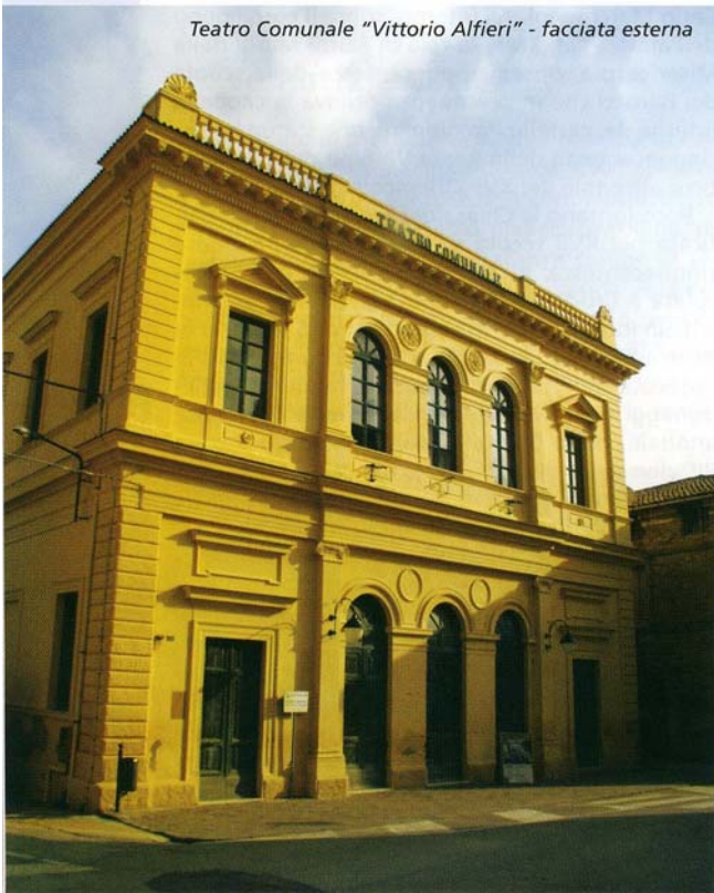
Teatro Comunale "Vittorio Alfieri" - facciata esterna

conformazione. Tale spiaggia è fruita in ogni estate da decine di migliaia di turisti "pendolari" provenienti dai Comuni dell'interno, fino all'Umbria, mentre si popolano e si vitalizzano i vari villaggi turistici della zona.