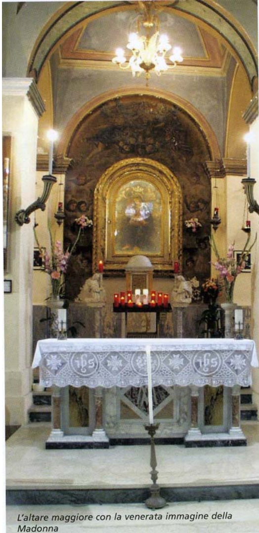
L'altare maggiore con la venerata immagine della Madonna