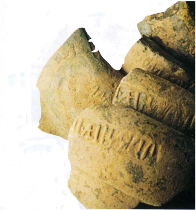
Frammenti di anfore romane

Il territorio del Comune di Montemarciano e in particolare la zona di Marina di Montemarciano fu certamente sede di insediamento romano, come testimoniato da recenti rinvenimenti: forse una "mutatio" o stazione di cambio lungo la via costiera. Lungo la statale 16, il Mandracchio risalente al 1400, rimane ancora come testimonianza dell'antica stazione di posta. Nel Medioevo, Montemarciano e Cassiano erano sedi di castello, e nel XV e XVI secolo il castello di Montemarciano fu "Vicariato" dei Malatesta e dei Piccolomini, feudatari in nome della Chiesa e di quest'epoca rimangono gli antichi Statuti, preziose testimonianze degli usi e costumi del tempo. Dopo il breve ducato di Ercole Sfrondati (1591-1593) il paese tornò in dominio diretto dello Stato Ecclesiastico, affidato al governo della camera apostolica fino all'annessione al Regno d'Italia.